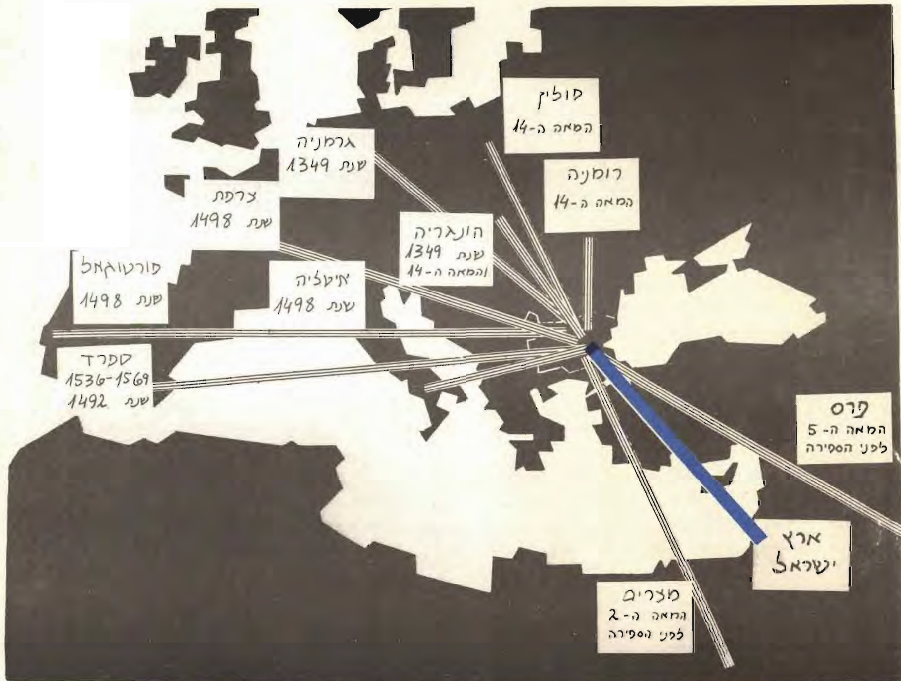
זוהי מפה פידורו של עם ישראל מתקופת הכיבוש הפרסי ועד מלחמת העולם השנייה ולאחריה. ריכוזם של מרבית היהודים בבלגריה (אם כי הם נמצאו בה מאות בשנים לפני הספירה) חל מהמאה ה-13 ועד המאה ה-16. הפתרון הייסודי עבור