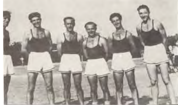
קיבוץ "ג" פעם - בגבולות ובמלמת השחרור.