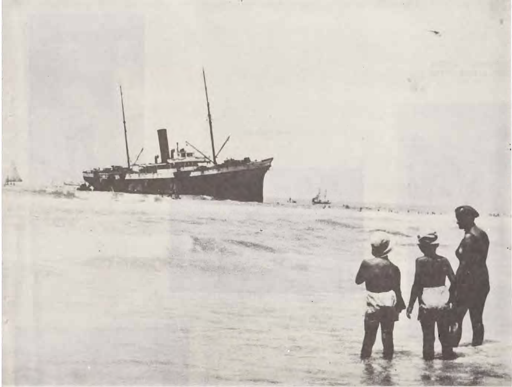
"טייגר-היל" הריקה מעולים והעזובה- בחוף תל-אביב