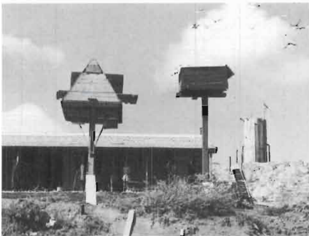
הצד המזרחי של הגבעה