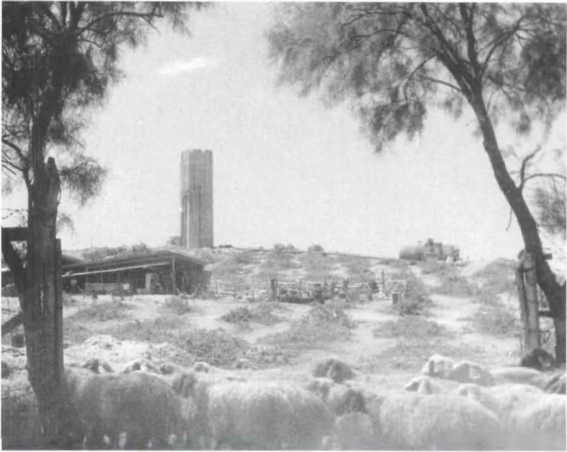
הצאן בכניסה לחצר