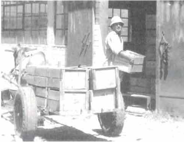
הובלת פרי לבית האריזה