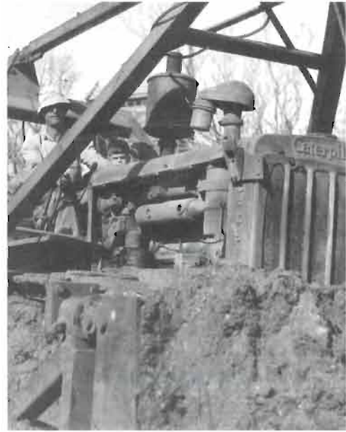
הבולדוזר שלנו בפעולה