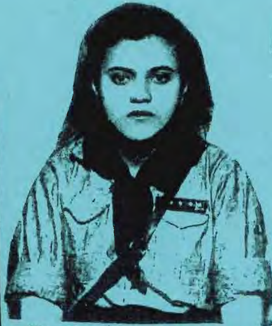
ג'ונ'ה - ז'ונ'ה ה'א'ג'ל'ה 1934