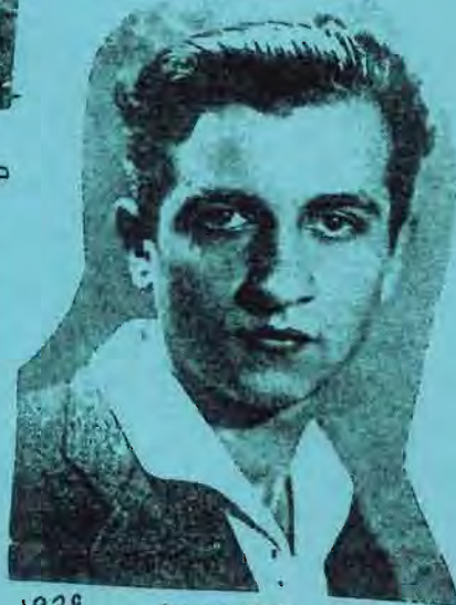
א'ר'י'ה - ד'ק'ו'א'ר'יק 1938