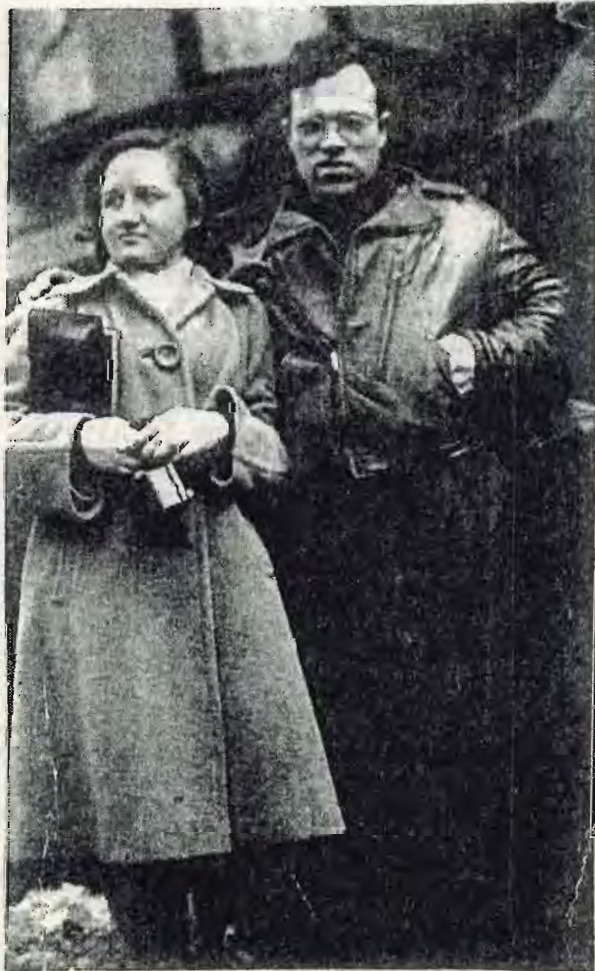
New York 1945

פנינה אחזור להתחלה: הגענו לקיבוץ עם תמונה מסוימת של חיי קיבוץ : שוויון, חיי חברה עשירים, מבחינה פוליטית - אחות עמים, אמונה באפשרות של חיים משותפים עם האוכלוסיה הערבית בארץ, תוך שכנות טובה. נראה לי שעשינו פחות מדי מבחינה פוליטית. כיום אצל הצעירים רואים עוד פחות מעורבות מאשר היה בדור שלנו. אני מאוד מאושרת שהבנים שלנו נשארו כאן בקיבוץ, הקימו משפחות יפות, שהם מאמינים בדרך זאת, כי בהחלט היו להם אפשרויות אחרות. מרגש אותי מאד לשמוע אותם מסבירים לאחרים את משמעות היותם כאן. אבל, יחד עם זה, יש לי חרדה לגבי ההמשך. אינני יודעת לאן יובילו השינויים המתחוללים בקרבנו. יש לי סיפוק אישי מהבנים והנכדים, אני גאה בהם, אבל אני חרדה מהמצב ההולך ומשתנה בארץ ובקיבוץ. אני מבינה שמוכרחים לחול שינויים. השאלה היא : האם נצליח לשמור על העקרונות שלנו, על הערכים שאנחנו מאמינים בהם ושלא נפסיד את העיקר, אני מרגישה שהגרעין היסודי באמונה שלנו הולך ונמוג, אולי אני טועה.