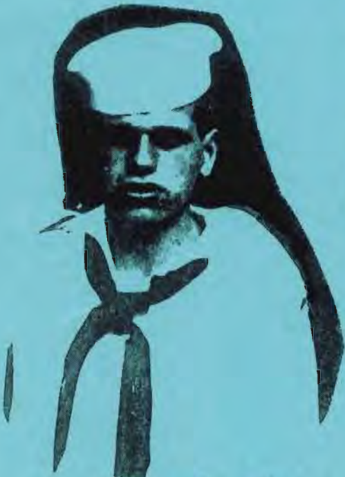
ח'ו'ס' - 32 פ'א'מ'ל'ק'ו'א' 1944