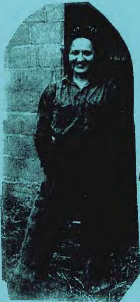
שטרני - ד'אור פה כ'סונ 1942