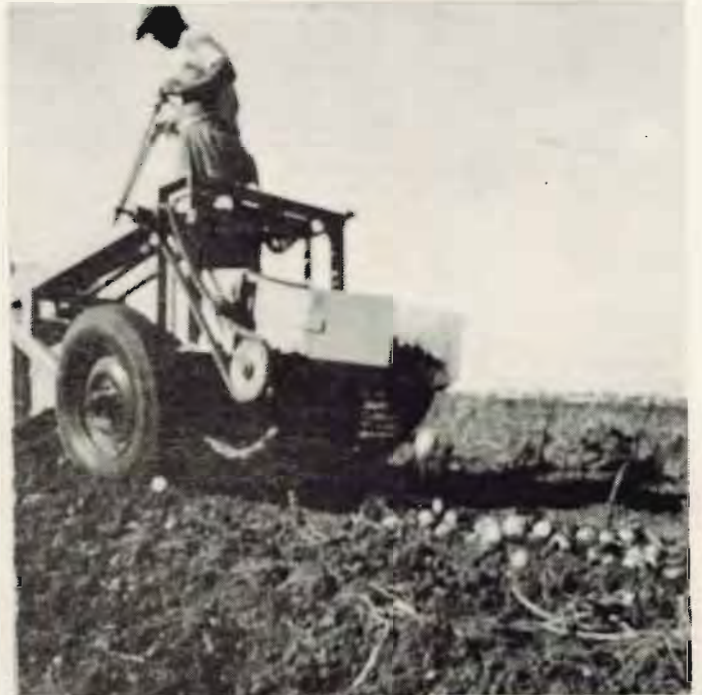
הוא קובע את קצב העבודה