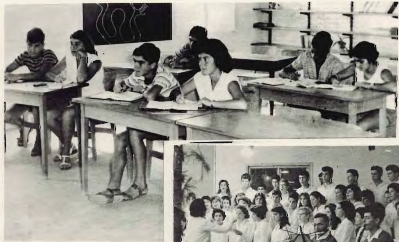
בני ובנות "אילה" בכיתה