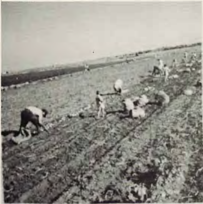
מהרר! תכף תחזור המכונה!