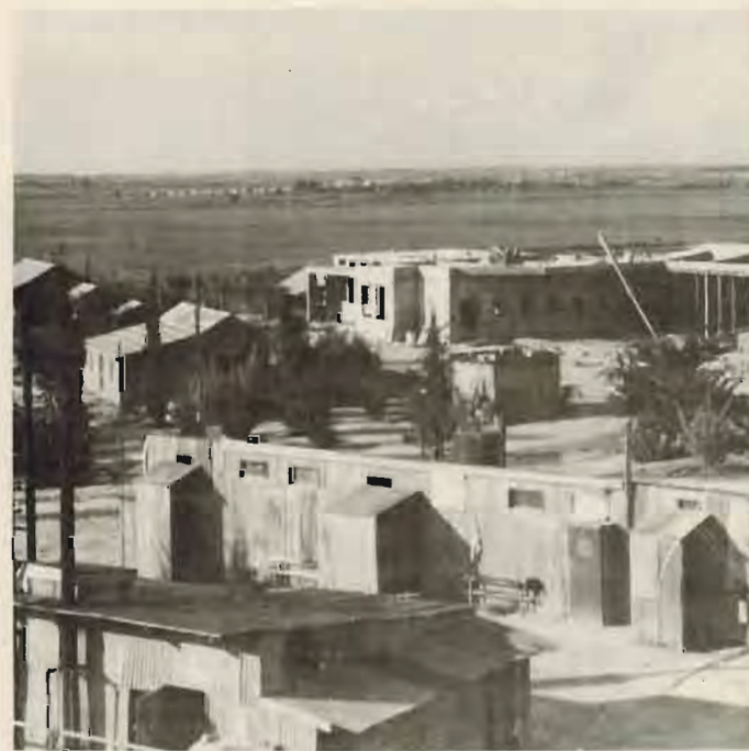
משמאל לימין: המכנסה - המקלחת הצבורית - חדר האוכל