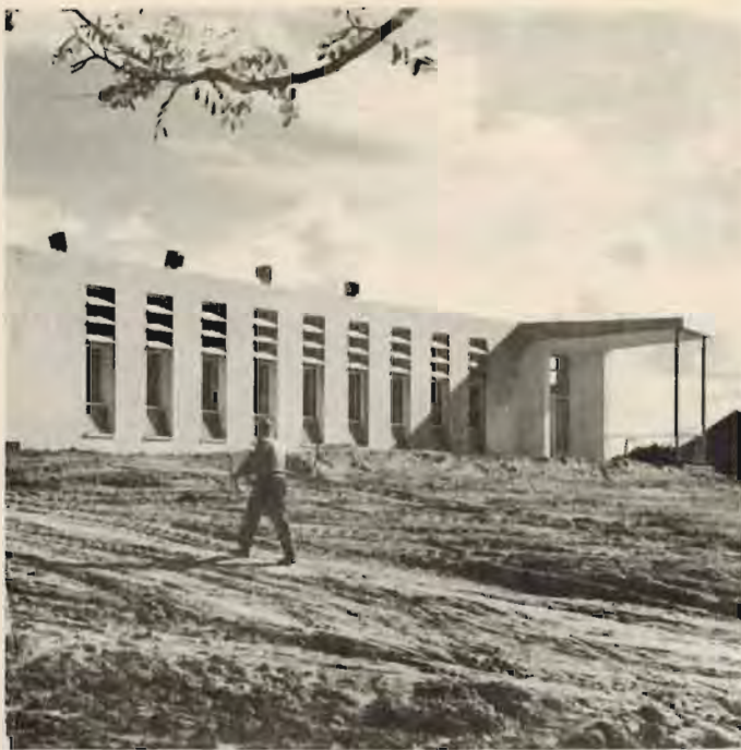
חדר האוכל החדש - חומר גלם לשיפורים ושיפורצים