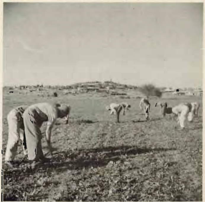
דילול ועישוב סלק טרסור (לשומרי משקל)