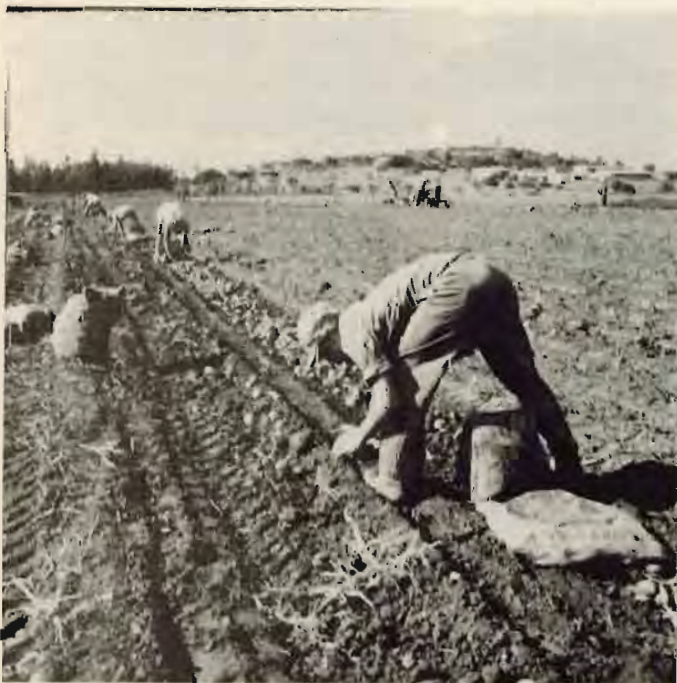
אישורף תפוחי אדמה - נוסח שנרות ה-50