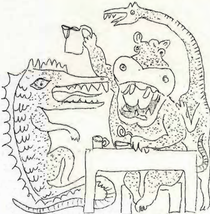
האוכלים באיני המגיש (3 יוני של יחיד איני)