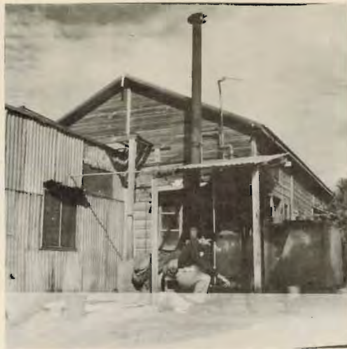
המטבח על הגבעה הדלקת התנור למים חמים