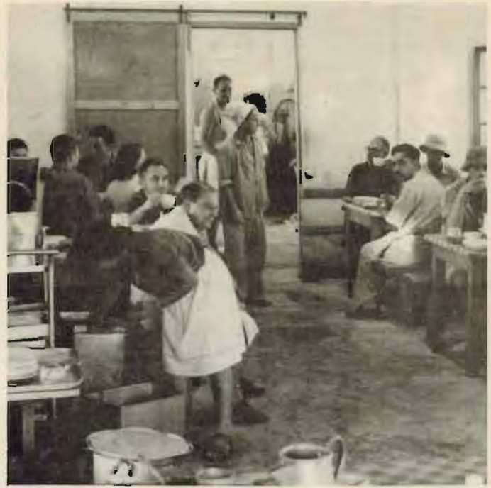
חרר האוכל בצריף על הגבעה