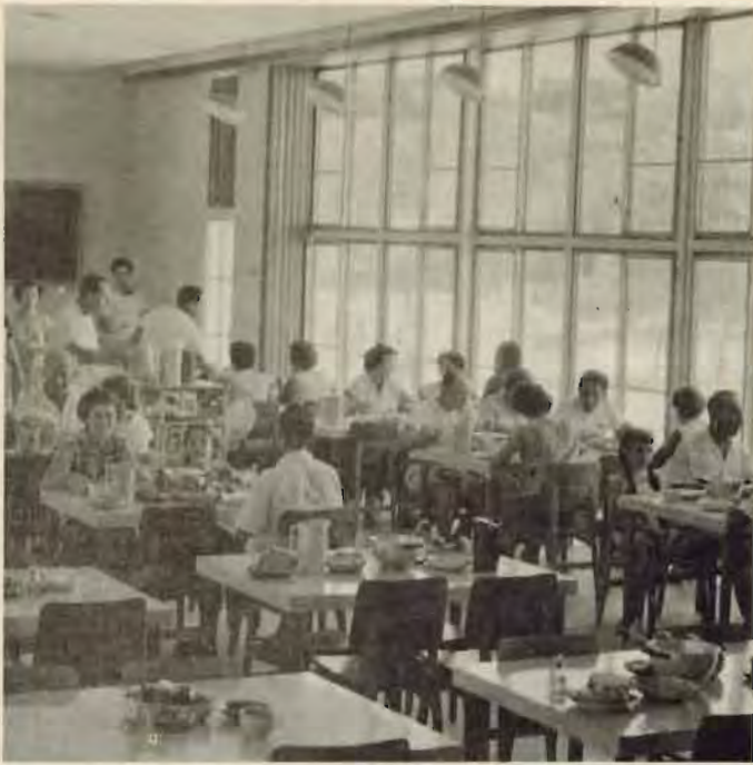
חרר האוכל החדש