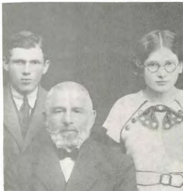
צביה עם אביה ואחיה