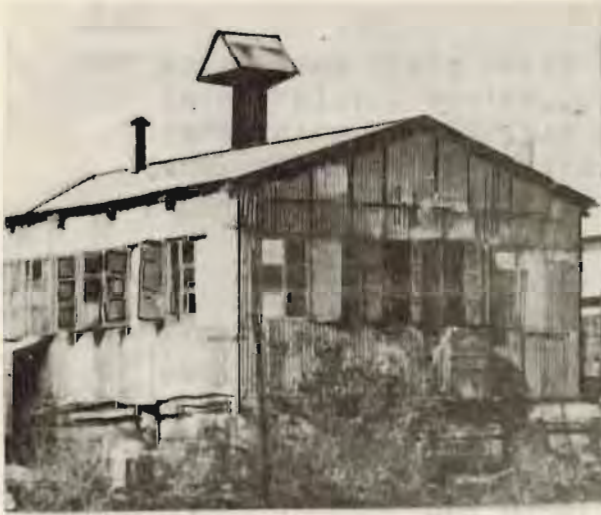
בית יציקה I

הפעולה הרעיונית: הבירורים שהתקיימו בראשית השנה הבליטו דבר שאינו משמע לשתי פנים: החינוך הרעיוני שהתקיים עד כה, אשר הסתמך בעיקר על מידע פוליטי ועל קריאת העיתונות היומית, איננו מספיק. לא רק מפני שאיננו מציד את החברים בידיעות יסודיות יותר, אלא בעיקר, מפני שאיננו מדרבן לפעילות מחשבתית עצמית. ידוע, שבשנים שהאחרונות לא נתקיימו בירורים רעיוניים, לא אצלנו ואף לא בקיבוצים רבים אחרים. הבירורים האחרונים חשפו את המקריות ואת השטחיות של ידיעותינו. לא אגזים, אם אומר, כי הלק ניכר מחברינו נרחק מספרות מדעית מרכסיסטית ובעיות הזמן משתקפות אצלם בכל היותר בצורה "פובליציסטית" במובנה הלא חיובי של המילה.