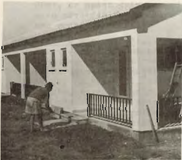
שיכון ותיקים I