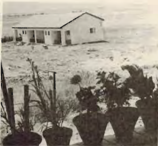
שיכון ותיקים ז

*** עם העברת המתפרה - זה שנים מטלטלת המתפרה ממקום למקום - נדחתה לכל חדר שמחפנה. תמיד "זמנית" ותמיד בצפיפות ודוחק. אך סוף סוף תורנו הגיע!! אמנם, גם הפעם אין זה המקום הקבוע. לזאת נגיע רק לכשיבנה הבניין הנכסף, שיכלול את המכבסה, את כל הקומונות, המחסנים והמתפרה - חלום לעתיד הרחוק! (ר'ק')