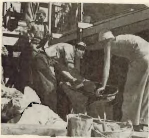
צ'יקה בחדר האוכל