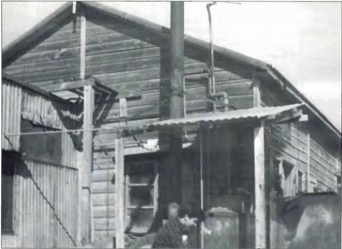
הדלקת התנור למים חמים במטבח הישן (1947)