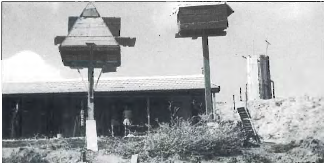
צריף ושובכי יונים על ה"טרסה"; מגדל המים על הגבעה (עדין בלי עצים מסביב)