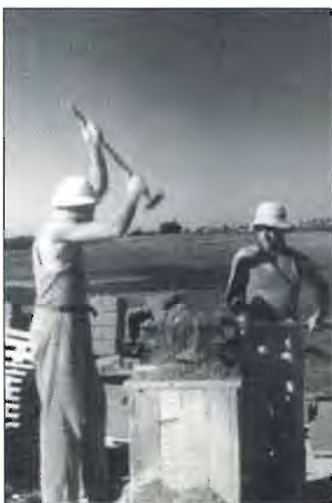
"דפיקות בלוקים" בית מחימר בכפר הערבי השכן ברקה