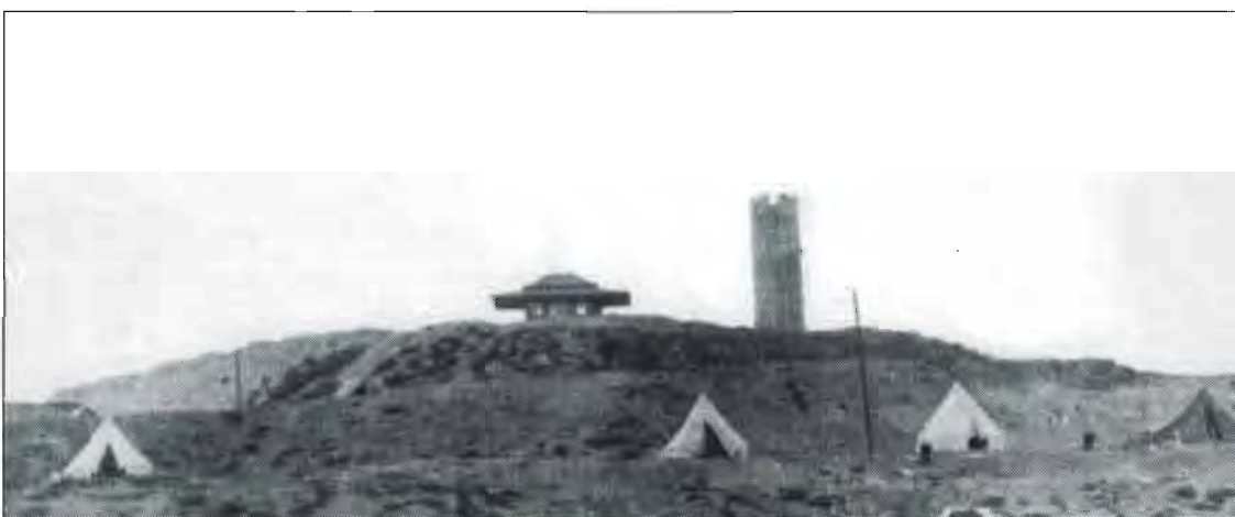
"טרסה" עם אהלים; הגבעה החשופה עם מגדל מים; חדר הקריאה