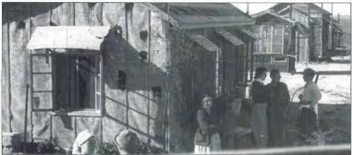
שיחת רעים ליד הצריפונים ב"מחצבה"