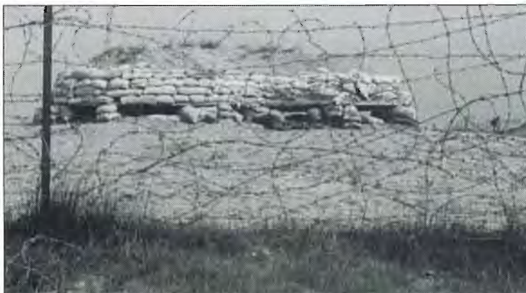
עמדה טיפוסית לתקופת מלחמת השיחרור: יעילה רק נגד נשק קל.