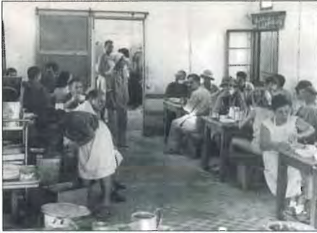
בחדר האוכל על הגבעה (היו בערך 80 מקומות ישיבה)