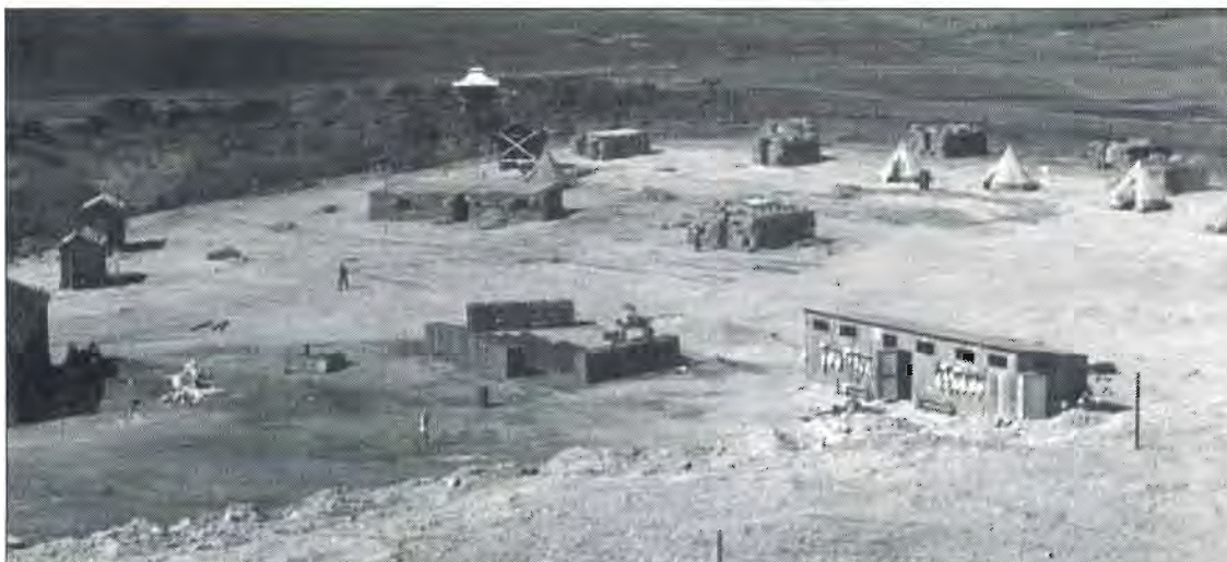
המחצבה עם צורות דיור שונות: אהלים, סוכות קש, צריפון "על קביים", צריפונים מראשון ומקלחת.