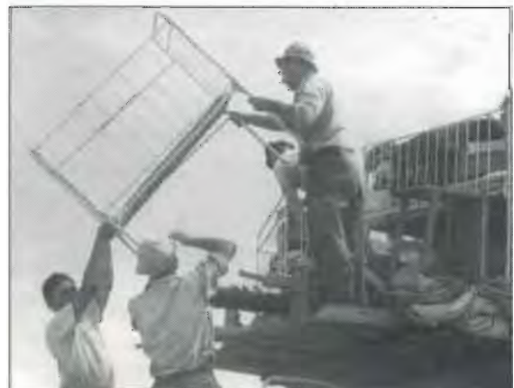
העמסת לולי תינוקות לקראת העברתם מראשון לחצור