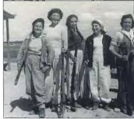
5 "נשות מגן" על הגבעה