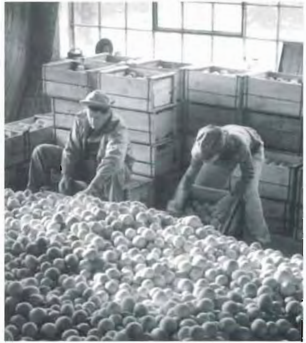
בתוך בית האריזה