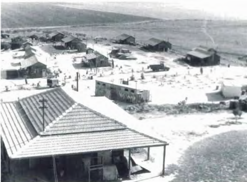
נוף חצור: חדר המוזיקה על הגבעה, המקלחת הציבורית, ה"קלובצ'יק", שורות של צריפונים