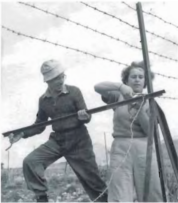
מותחים גדר בטחון