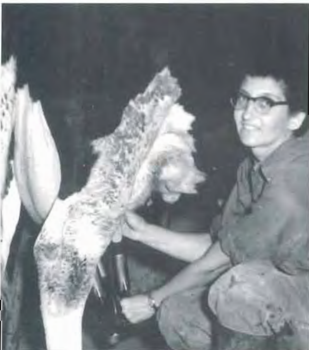
סוף סוף חולבים במכונה