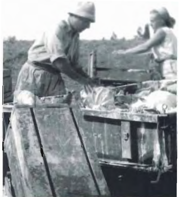
אורזים כרוב בגן הירק