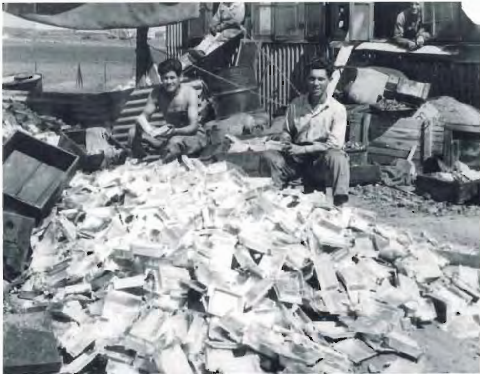
ליד בית היציקה הישן שוברים יציקות