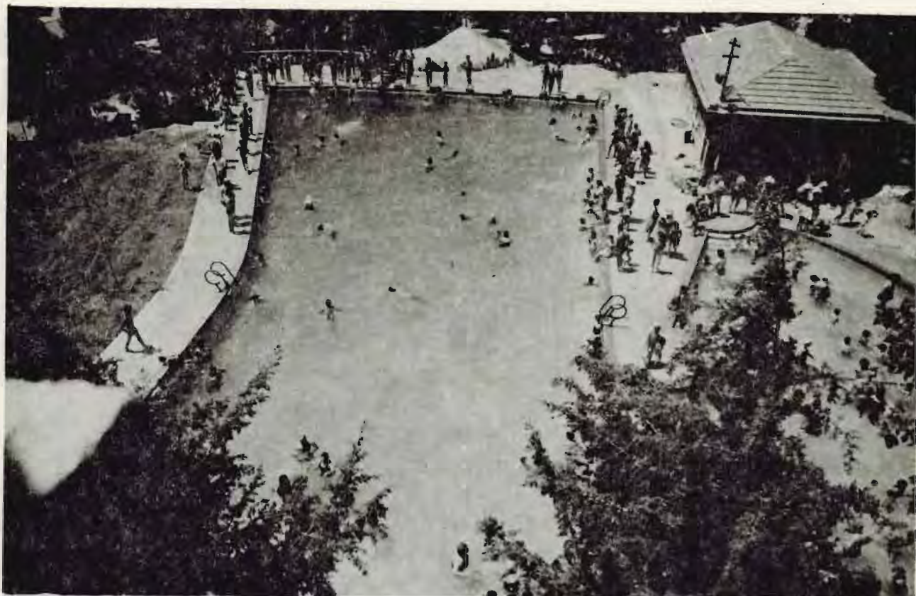
בריכת השחיה ב-1959. לפני שהורד צריף הספרייה.