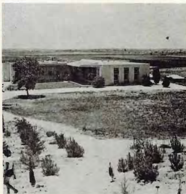
חדר האוכל כשהיה בעל אגף אחד בלבד. בערך ב-1960