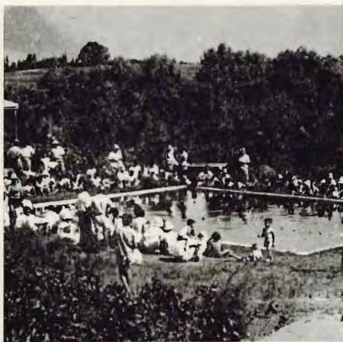
"יחג" פתיחת בריכת השחיה: אביב 1959.