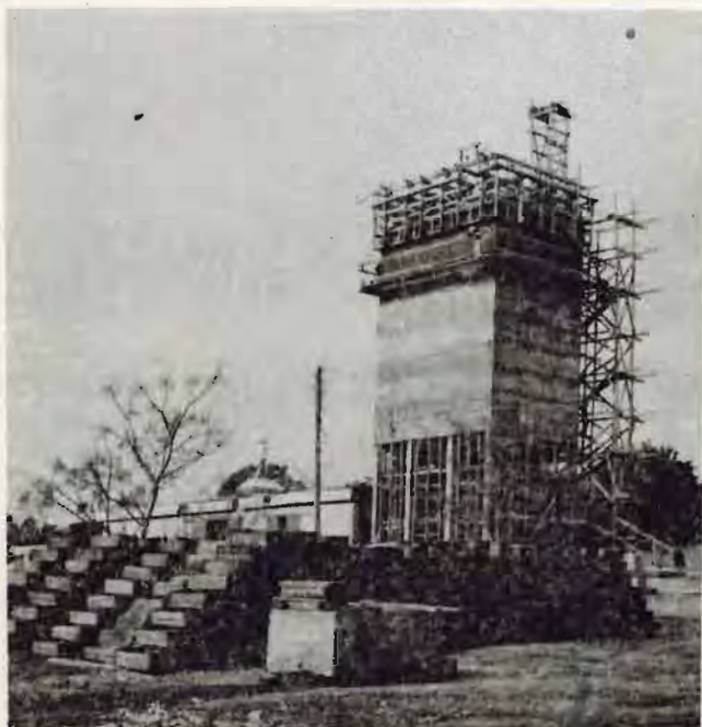
בניית האסס בעזרת ה"תבנית המתרוממת". למטה-ארגזי חפ"א לאחר חיטוי.