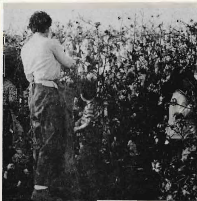
גיוס לקטיף כותנה בקצוות השרה. בערך 1962.