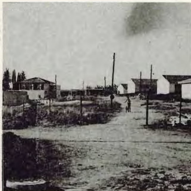
גבעת המוסד ב-1960. בצד שמאל-המעכדה. מאז התרוספו כמה עצים.