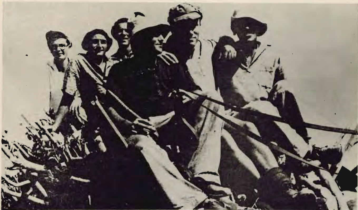
מפעל העצים להטקה