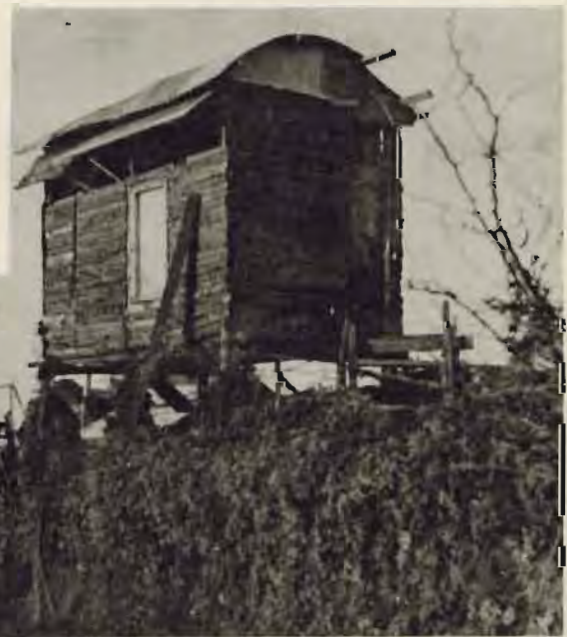
צרות של דור